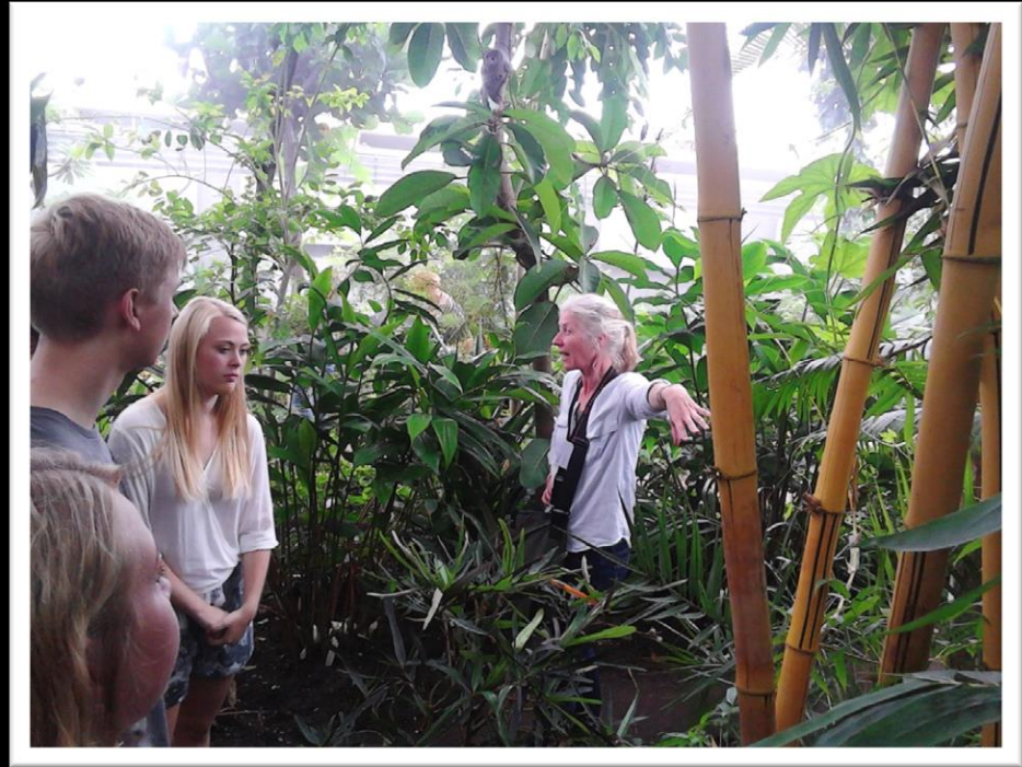
I Væksthusene får eleverne viden om bambus