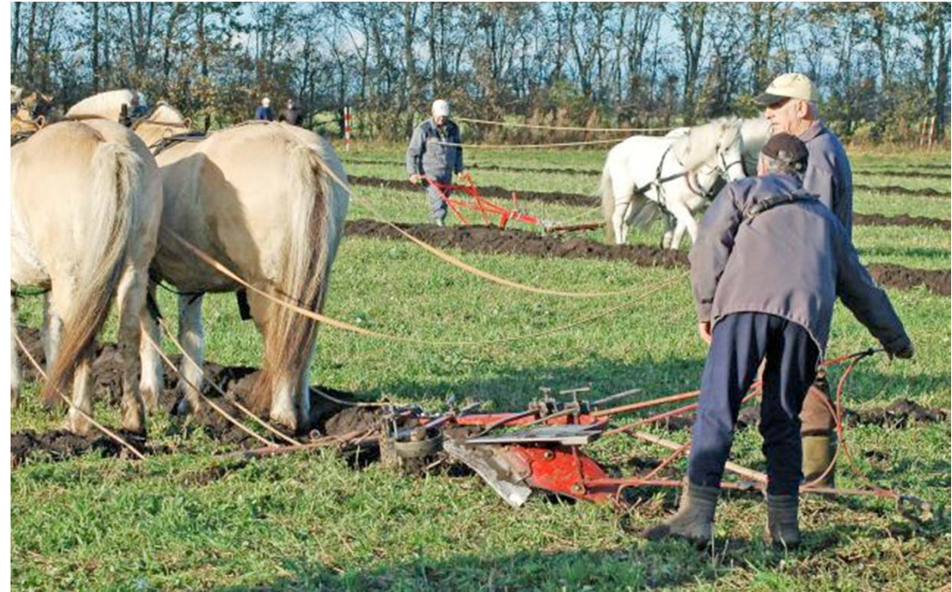
DM og NM i pløjning på Dansk Landbrugsmuseum, Gl. Estrup.